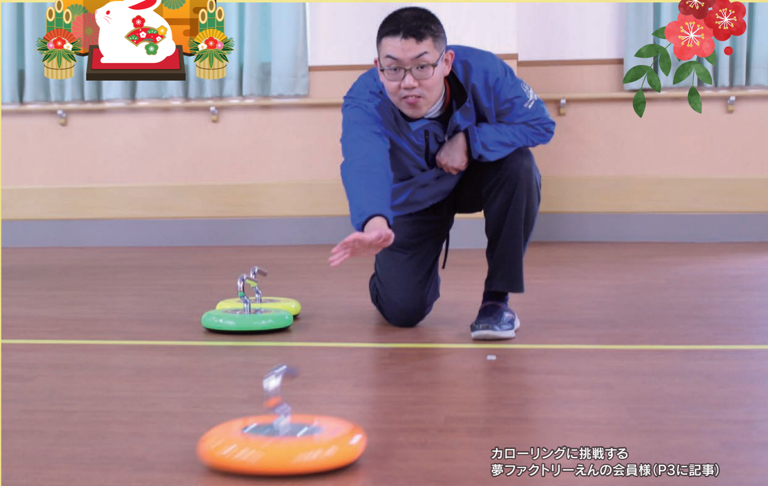
カロールリングに挑戦する 夢ファクトリーえんの会員様(P3に記事)