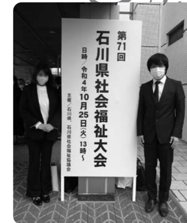
石川県社会福祉大会にて、石川県知事表彰と石川県社会福祉協議会会長表彰の表彰式が行われました