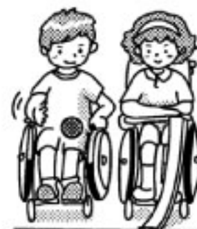
投球補助具「ランプ」

白色のジャックボール（目標球）に、いかに自分たちのボールを近づけるかを競うスポーツ。 各チームが投げる手数は6球。最終的に、それぞれが一番近い球を比べ、速いチーム（●）の球の位置が基準の範囲になります。その範囲の中にある球の数が得点です。