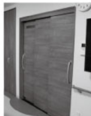
車椅子でも出入りしやすい3枚扉

の準備や洗濯など生活面は、世話人と呼ばれるスタッフがサポート。スタッフのAさんは「会員さまとの触れ合いは、感覚の繊細なところや常識にとられない大胆さがあったりと、ハッと気づかされることが多いです。自分の心が磨かれるきっかけを貰っています。まるで家族のように、笑顔があふれる温かい場所を作っていきたいです」とにっこり。地域の中で自分らしく暮らすお手伝いをしていきます。