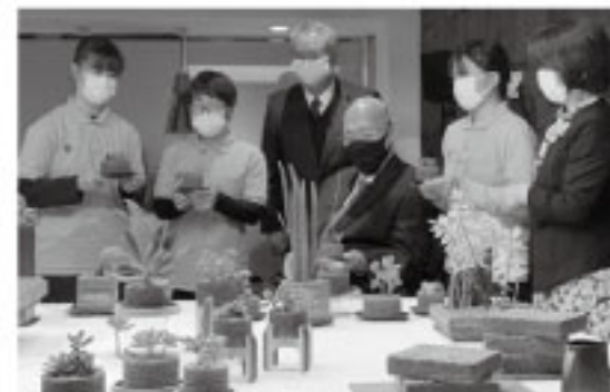
商品はレストラン「ゴッツォーネ(小松市)」で販売しており 今後インターネットでも販売予定

これからも地域の皆さまのご支援を頂きながら、会員さまが可能性の花を開かせる支援を行っていきます。